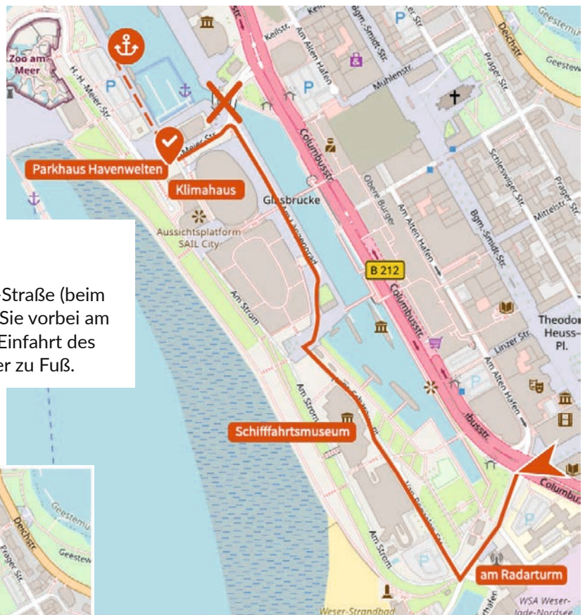
Bild: Karte zum Parkhaus Havenwelten

Fahren Sie von der Columbusstraße in die Van-Ronzelen-Straße (beim Radarturm). Eine ausgeschilderte Umleitungsrouten führt Sie vorbei am Deutschen Schifffahrtsmuseum und dem Klimahaus zur Einfahrt des Parkhauses Havenwelten. Von dort sind es ein paar Meter zu Fuß.