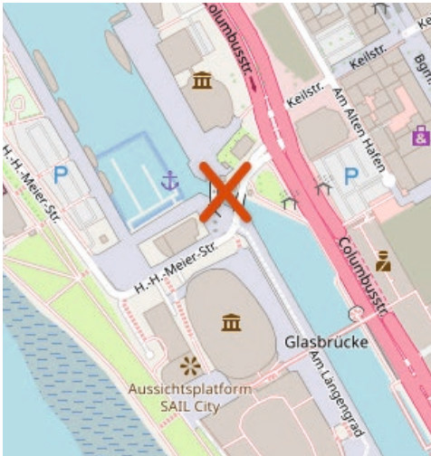
Bild: Position gesperrte Brücke

Seit dem 8. Juni 2026 ist die Klappbrücke zwischen dem Neuen und dem Alten Hafen für mindestens 3 Jahre gesperrt. Lediglich die Glasbrücke, Holländische Klappbrücke und der Steg im Alten Hafen sind begehbar. Im Folgenden finden Sie Möglichkeiten, um zum Liegeplatz zu gelangen.